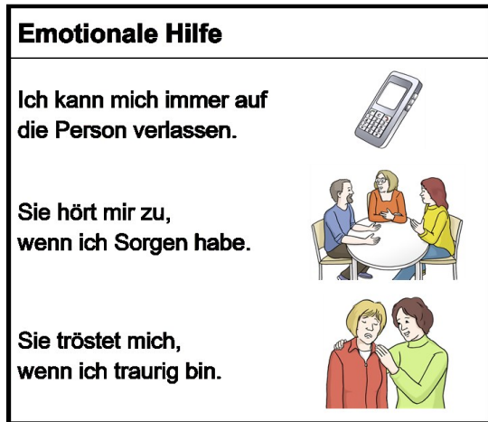
Abb. 2: Bildkarte Emotionale Hilfe (Mit freundlicher Genehmigung von Lebenshilfe Bremen e.V: (2013), Illustrator Stefan Albers, Atelier Fleetinsel)

Im Ergebnis wird deutlich, dass die Eltern von wenig sozialen Kontakten (durchschnittlich zwölf) berichten, wobei der größte Teil auf Familienangehörige und Fachkräfte entfällt. Die Netzwerke der Freund*innen und Nachbar*innen sind besonders klein, einige Eltern nennen keinen einzigen Kontakt in diesen Bereichen. Auch hinsichtlich der persönlichen Bedeutung der Kontakte stehen Familienangehörige und Fachkräfte an vorderster Stelle. Der hohe Stellenwert von Fachkräften im Leben der befragten Familien wird in folgendem Zitat deutlich: