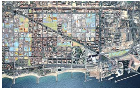
Imagen 3: mapa físico del 22@.

Significa crear un “nuevo” centro para una ciudad, incorporando un elemento que complementa la ciudad turística y de negocios que ya es Barcelona. No es casual que una de las imágenes que Barcelona vende en la actualidad sea la Torre Agbar, diseñada por Jean Nouvel. Sin duda, este edificio, una de las puertas de entrada del 22@, es un símbolo fruto del diseño de su construcción, de su forma de iluminarse y de la tecnología aplicada. Una Barcelona plenamente integrada al contexto social tecnológico que estamos viviendo. El triangulo de las puertas de entrada de esta “nuevo punto central estratégico” de Barcelona se complementa con el edificio del Fórum y con la estación del AVE de la Sagrera (en proyecto de construcción). El nuevo barrio del 22@ y la ciudad están incorporando e incorporaran en su imaginario colectivo estas tres imágenes más actuales, mezcla de tecnología, de negocio y de la arquitectura más actual.