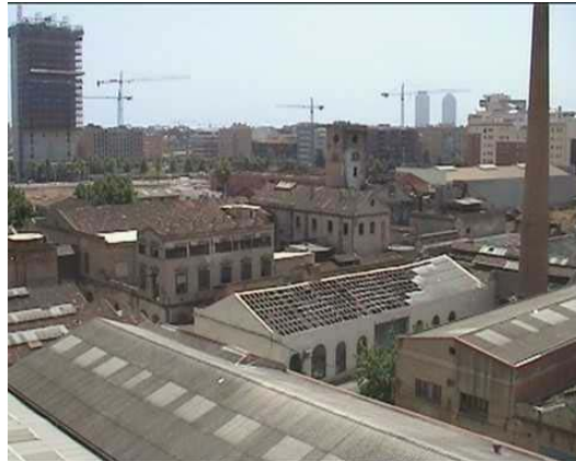
Imagen 1: el complejo de Can Ricart en l'actualidad.

en construcciones de nueva planta. En la misma calle Pallars, en el tramo cercano a la rambla del Poble Nou, destaca un conjunto de muros repletos de grafitos. Los grandes espacios de las naves industriales también han sido aprovechados como discotecas, convirtiendo al Poblenou en una de las zonas de ocio nocturno de la ciudad. Y finalmente debemos destacar el complejo de Can Ricart como una de las piezas de mayor interés del patrimonio industrial del barrio.