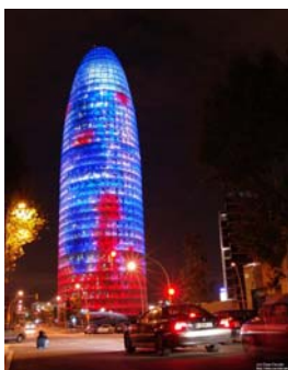
Imagen 4: Torre Agbar.

Significa crear un “nuevo” centro para una ciudad, incorporando un elemento que complementa la ciudad turística y de negocios que ya es Barcelona. No es casual que una de las imágenes que Barcelona vende en la actualidad sea la Torre Agbar, diseñada por Jean Nouvel. Sin duda, este edificio, una de las puertas de entrada del 22@, es un símbolo fruto del diseño de su construcción, de su forma de iluminarse y de la tecnología aplicada. Una Barcelona plenamente integrada al contexto social tecnológico que estamos viviendo. El triangulo de las puertas de entrada de esta “nuevo punto central estratégico” de Barcelona se complementa con el edificio del Fórum y con la estación del AVE de la Sagrera (en proyecto de construcción). El nuevo barrio del 22@ y la ciudad están incorporando e incorporaran en su imaginario colectivo estas tres imágenes más actuales, mezcla de tecnología, de negocio y de la arquitectura más actual.