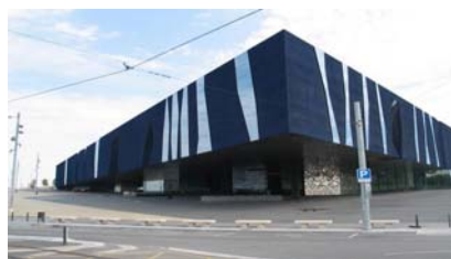
Imagen 5: Edificio del Fórum.