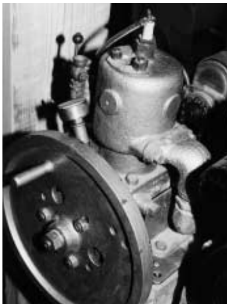
Abb. 5 Finnischer Kleinmotor (2 PS) von 1957 aus der »Kellerwerkstatt« von Kruth in Jakobstad/Pietarsaari.

Die speziellen Ursachen für diese im Ostsee-raum einmalige Massierung von Bootsmotoren-»Schraubern« ist noch ungenügend erforscht. Einige Grundbedingungen dürften dafür von Bedeutung gewesen sein: zum einen