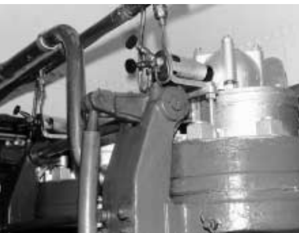
Abb. 1 Dänischer Vølund-Glühkopfmotor mit Schnellerhitzer.