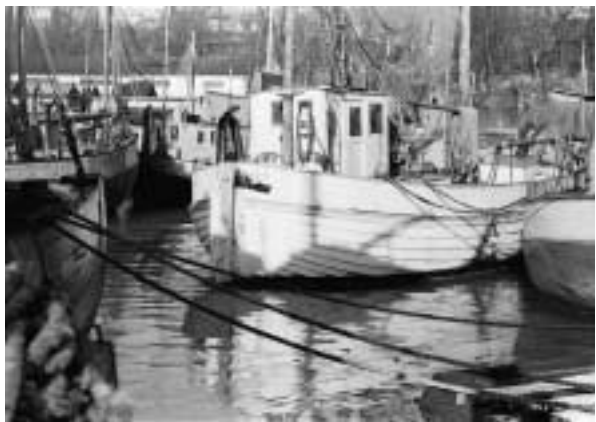
Abb. 7-8 Der Saßnitzer Fischerhafen, 1958.

zitätswerk in Betrieb genommen. Behörden hielten ihren Einzug in das Dorf: zuvorderst das Hafenamts mit der Lotsenstation und einem Bauhof, dann das Postamt, das Zollamt sowie ein schwedisches Vizekonsulat.