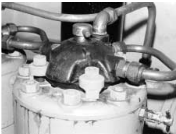
Abb. 2 Dänischer Hundested-Mitteldruckmotor mit Patronenstarter.

heit an. Dänische Motorenwerke, voran die Hundested Motorfabrik, kreierte wenig später den sogenannten »Kaltstart« mittels einer in den Glühkopf geschraubten Zündpatrone. Von nun an stand für die »Großen« ein nahezu ideales Schwergewichts-Angebot zur Verfügung. Für diese Generation von Bootsantrieben hatte sich seinerzeit die Fachbezeichnung »Semi-Diesel« eingebürgert.