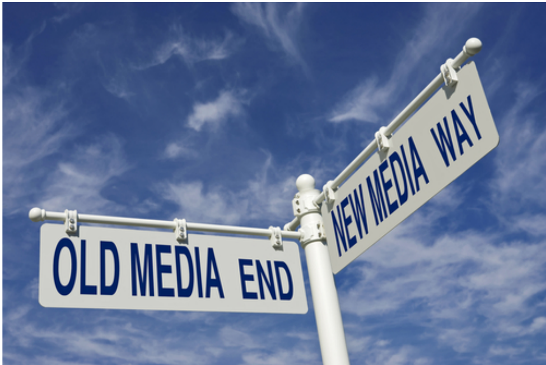
Abb. 1 Illustration zum DIGC 202 Blogbeitrag vom 19.9.2012 „The Cultural Logic of Media Convergence“