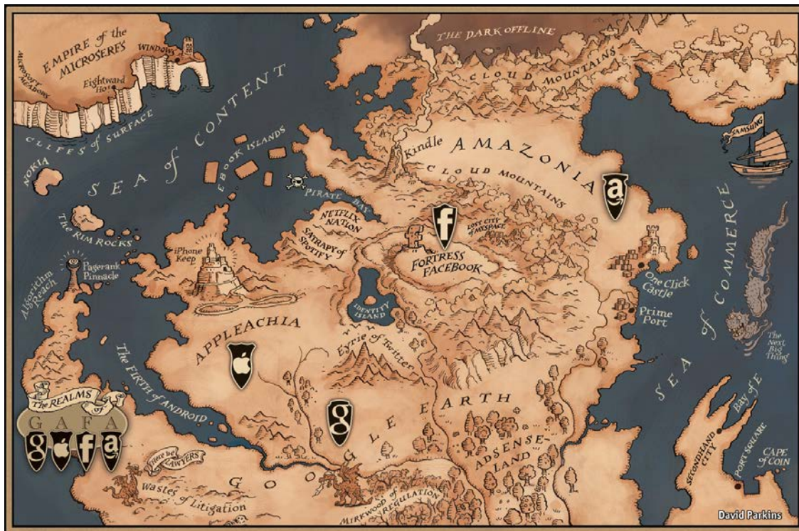
Abb.5 Die Okkupation des Internet durch die führenden Media Cloud-Plattformen Cartoon im Economist vom 1. 12. 2012 über die konfligierenden „Enclosure“-Strategien der Konzerne