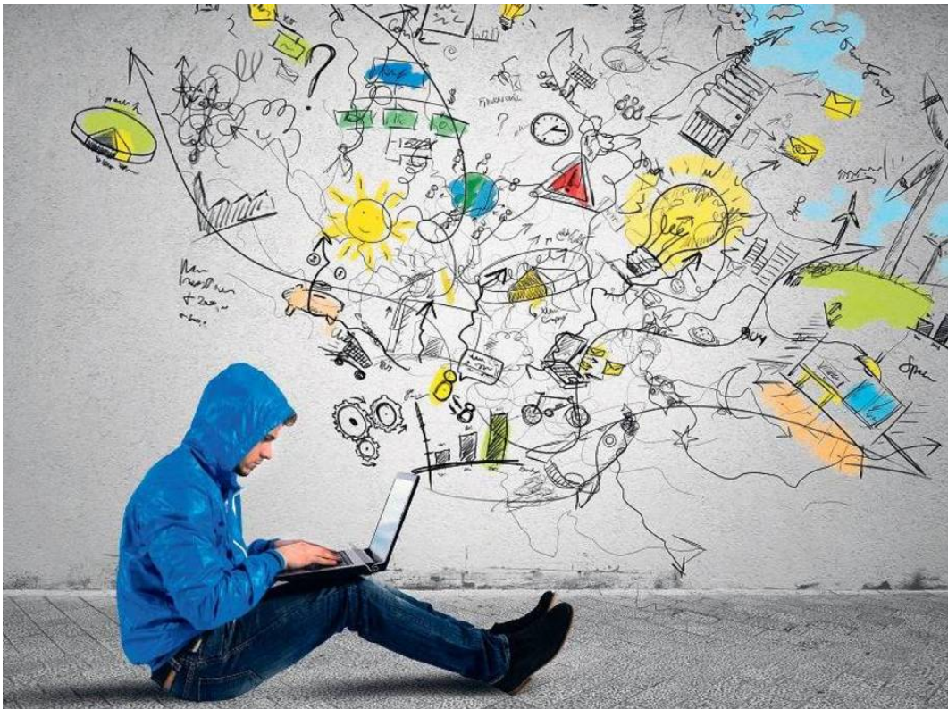
Abb.2 Souveräner Hypermedia-User oder prekärer Croudworker in der Platform Economy ?