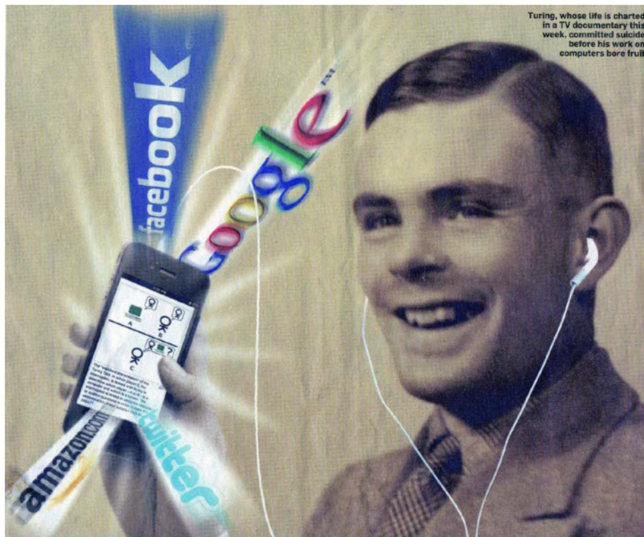
Abb. 3 Die Turing-Media-Legende: Fotomontage für die von Google gesponserte „Turing Centenary Exhibition“ 2011 3