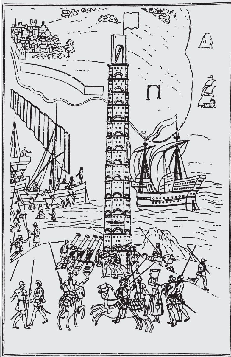
Abb. 1 Der Leuchtturm von Boulogne auf einem Holzschnitt des 16. Jahrhunderts (nach Schulze 1987).

Generationen hin eine ständige Bedrohung für das Frankenreich waren. Ihre Taktik, sogar Pferde für die nahtlose Fortführung der Angriffe mitzuführen 9 , muß für die Bedrohten immer wieder geradezu verheerend gewesen sein. Die eingeleiteten Gegenmaßnahmen wirken verblüffend.