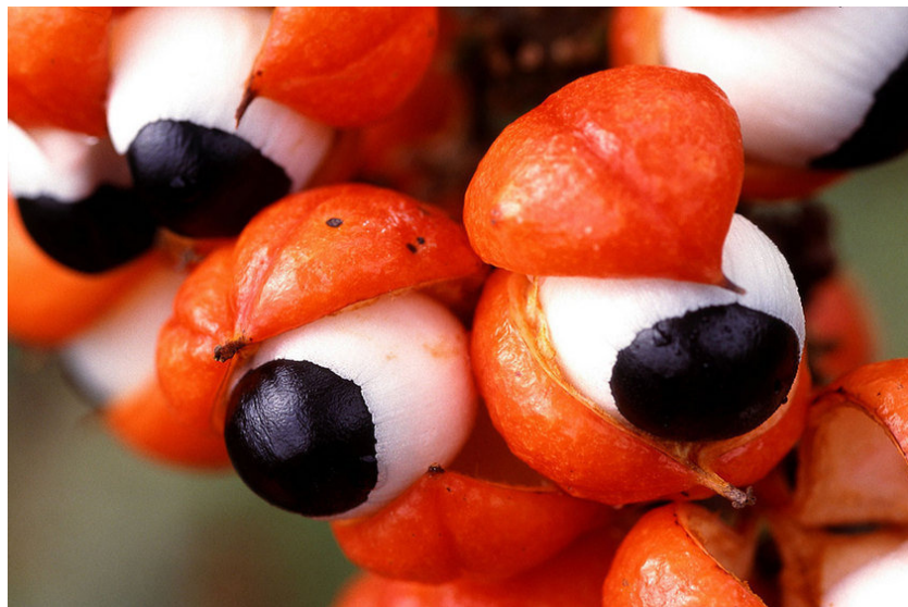
Figura 2: Imagem do fruto do guaraná

universal, o símbolo da percepção intelectual". (GHEERBRANT; CHEVALIER, 1998, pág. 653). Quando maduro, o fruto do guaraná é avermelhado com polpa branca e sementes negras (Figura 2) e que se assemelham aos olhos humanos.