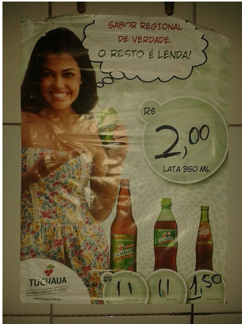
Figura 3: Fotografia de um cartaz do guaraná Tuchaá colado na parede de um bar.