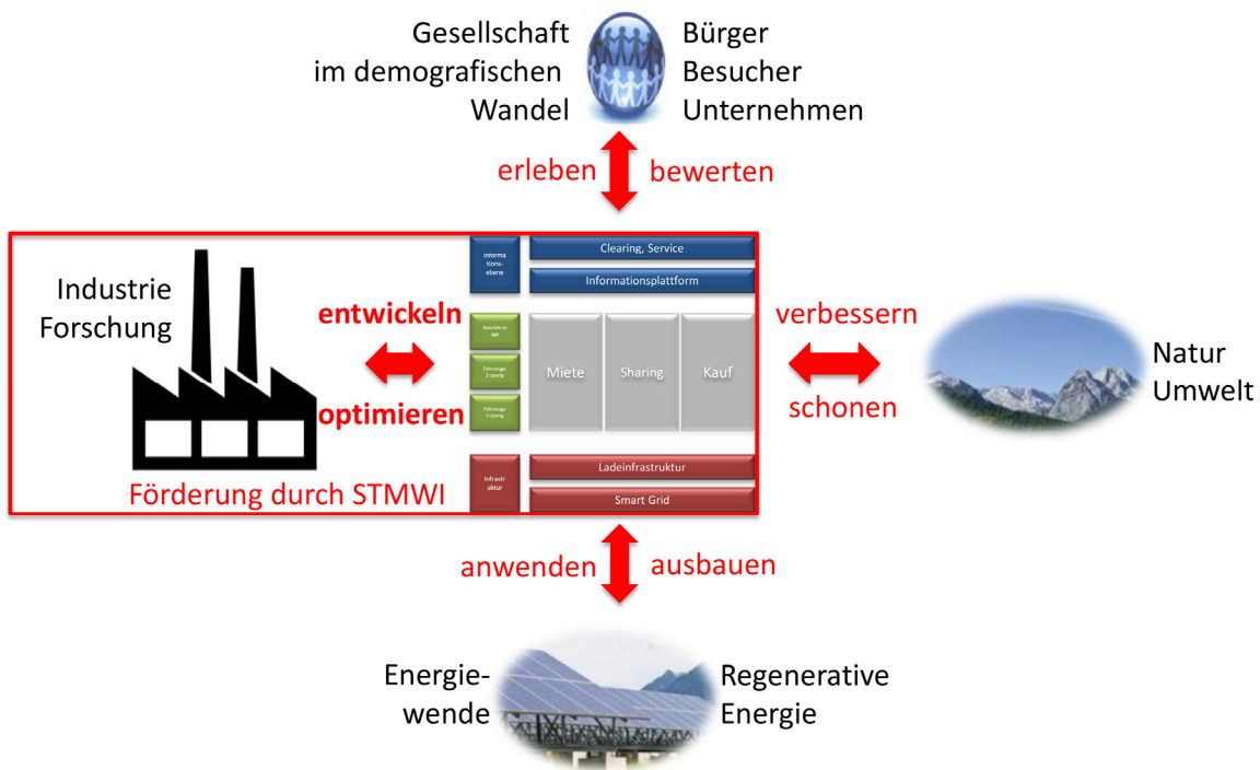
Abb. 1: Übersicht über die möglichen Erkenntnisse und Wirkungen eines Elektromobilitätsprojekts im ländlich-touristischen Raum

Zusammenfassend sind die Ziele und Wirkungen des Vorhabens in Abbildung 1 dargestellt.