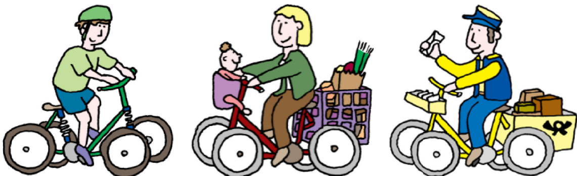
Abb. 6: Verschiedene Einsatzszenarien des Quadrads