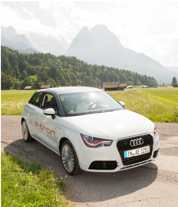
Abb. 5: Technikträger A1 e-tron

Das Vorhaben hat mehrere Ziele. Zunächst gilt es, das Kundenverhalten bezüglich der unterschiedlichen Fahrzeuge festzuhalten und zu analysieren. Darunter fallen beispielsweise Punkte wie: