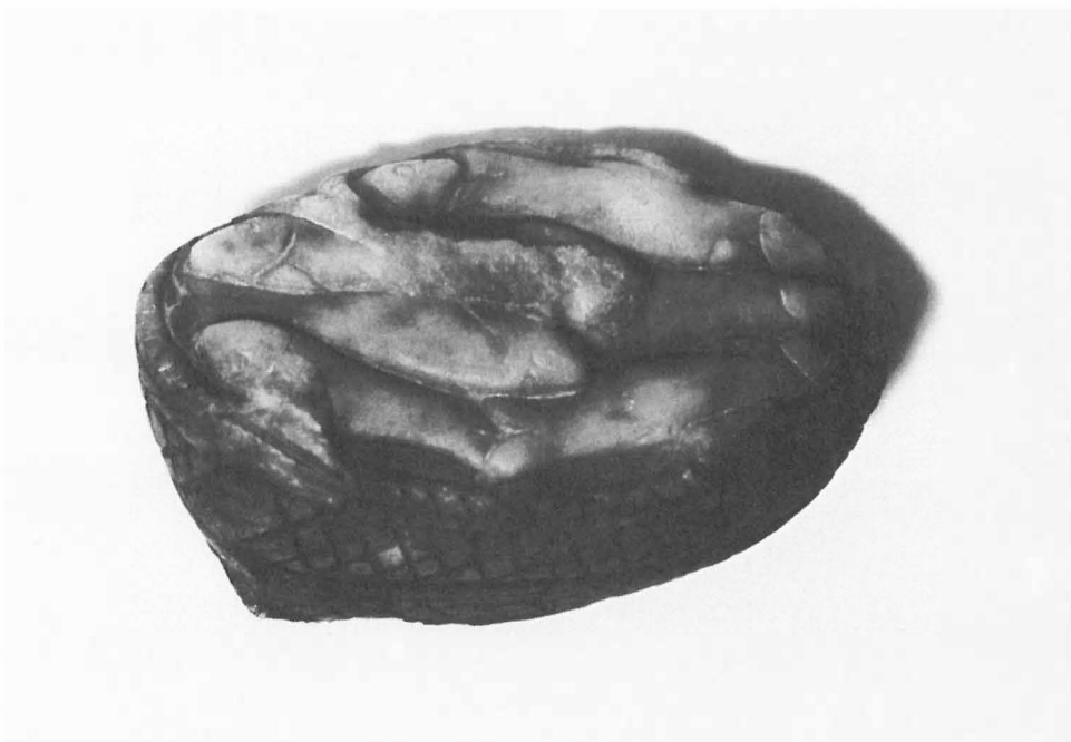
Abb. 4 Fische im Senknetz. Fragment einer römischen Marmorplastik aus der Orbe, Westschweiz. Länge 12 cm. (Bernisches Historisches Museum).

Die Bedeutung des Borkener Einbaumes liegt nicht nur darin, einen weiteren archäologischen Nachweis einer besonderen Variante der Senknetzfischerei zu liefern. Der Einbaum ermöglicht es vielmehr erstmals, diese Fangmethode archäologisch in größere zeitliche Tiefen zu verfolgen, denn jetzt kann man unter den bisher ausgegrabenen Einbäumen gezielt nach gleichartigen Vorrichtungen für dieselbe Fangtechnik suchen. Leider sind nur so wenige Einbäume durch gut vermessene Zeichnungen publiziert, daß diese Suche nicht nach der Literatur, sondern nur in den Keller- und Bodenräumen der Museen erfolgen kann.