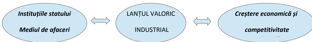
Fig. 1.3 Modelul creșterii economice prin lanțul valoric industrial