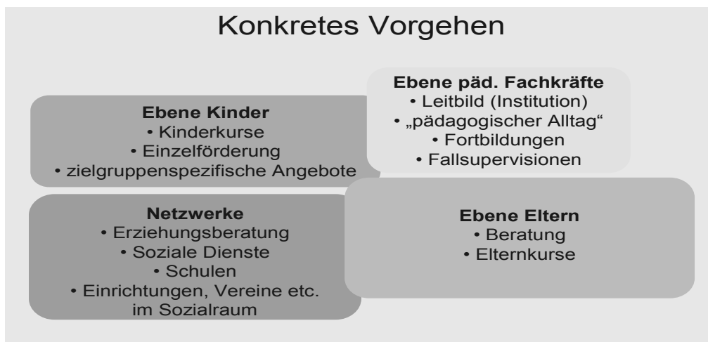
Abb. 1: Grundsätzliche Projektkonzeption

Auf den hier dargestellten vier Ebenen der Programmdurchführung wurden im Einzelnen folgende Interventionen realisiert: