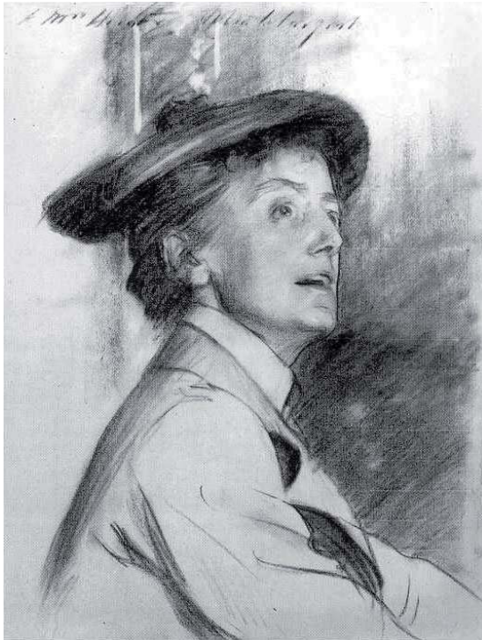
Abbildung 1: John Singer Sargent. Dame Ethel Mary Smyth. 1901. Kreidezeichnung

So verwundert es heute kaum, dass sie sich der Suffragettenbewegung anschloss. Ihr Engagement für die Sache der Frauen entsprang ihren eigenen leidvollen Erfahrungen im Musikleben. Die Auseinandersetzung mit ihrem Geschlecht begleitete Smyth ihr Leben lang und äußerte sich nicht nur in ihrer Beteiligung an der Suffragettenbewegung, sondern auch in ihrer Musik, ihren Schriften und sonstigen Aktivitäten. So ist es lohnenswert, die Komponistin nicht nur in rein musikalischen Kontexten zu betrachten, sondern den Blick auf ihr eigenes, vielfältiges Selbstbild und ihre sonstigen Handlungsweisen zu richten. 1 Da das Selbstverständnis der Komponistin durch das Bewusstsein