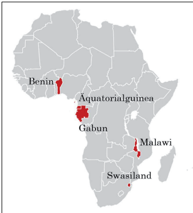
Abbildung 1: Friedensinseln in Subsahara-Afrika