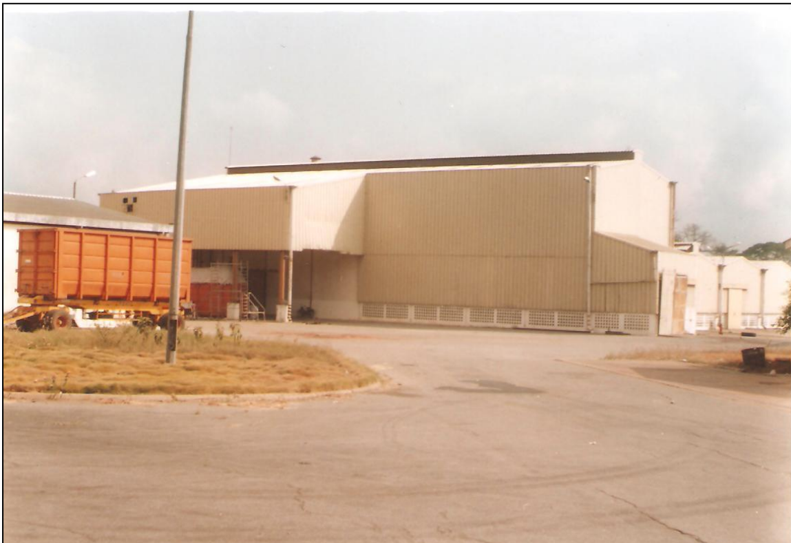
Photo 3 : Vue de l'usine d'égrenage sans activité de Zatta dans le bloc Centre

La crise militaro-politique de septembre 2002 a accru le déficit financier des sociétés cotonnières et cela a eu pour conséquence le retard de paiement des revenus des producteurs. Cette situation a été à l'origine de l'émergence des pisteurs qui sont en fait des commerçants qui achètent le coton-graine sans avoir financé les intrants et à un prix inférieur au prix fixé. Ils le font soit pour le compte d'une structure, soit pour le revendre ensuite à un égreneur [3]. L'autre raison est la chute de la production cotonnière qui est passée de 400 000 à 120 000 tonnes entre 2001 et 2008, entraînant une surcapacité des sociétés cotonnières et la course au coton-graine. Cette surcapacité a orchestré la fermeture de certaines usines comme celle de Zatta située dans le bloc cotonnier Centre (Photo 3).