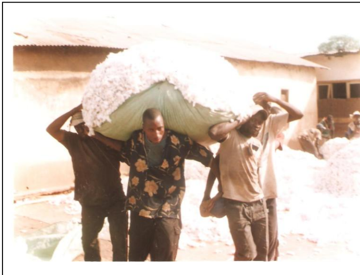
Photo 1. Transport d'une bâche par les jeunes

Avant la libéralisation, la collecte du coton-graine était assurée par les Groupements à Vocation Coopérative (GVC) qui avaient un rayonnement au niveau villageois. Mais en décembre 1997, dans le souci de préparer les producteurs à la libéralisation, une nouvelle loi coopérative a été mise sur pied. Cette loi a autorisé la création de coopératives à l'échelle sous-préfectorale et départementale. Ces coopératives ont la possibilité de mettre en place des sections ou des sous-sections dans les villages de leur aire de couverture en vue de la collecte du coton-graine en leur nom. A Aka N'guessankro-campement par exemple, l'organisation de la commercialisation du coton-graine est assurée par la section de la Coopérative Zone de Savane de Bouaflé (CZSB) (Photo 1 et 2).