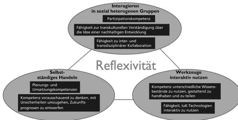
Abbildung 1: Gestaltungskompetenz im Rahmen des DeSeCo-Modells (Barth 2007, S. 55).

Im Zentrum von BNE stehen damit Lernprozesse zur Ausbildung von Gestaltungskompetenz, die durch die Verbindung konkreter Inhalte mit innovativen Lehr- und Lern-Methoden gefördert werden sollen. Notwendig ist hierfür ein tieferes Verständnis der Prozesse des Kompetenzerwerbs und der unterschiedlichen Einflussfaktoren und Gelingensbedingungen in spezifischen Lernsettings.