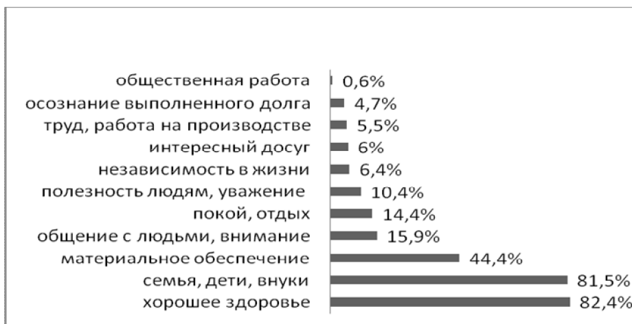
Рис. 2. Ценности пенсионеров