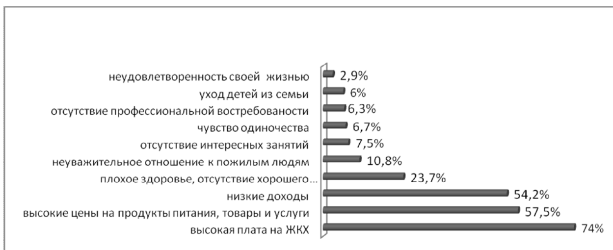
Рис.3. Что из ниже перечисленного является лично для Вас наиболее острой проблемой?

Мужчины чаще, чем женщины сталкиваются с такими проблемами, как отсутствие интересных занятий и отсутствие профессиональной востребованности.