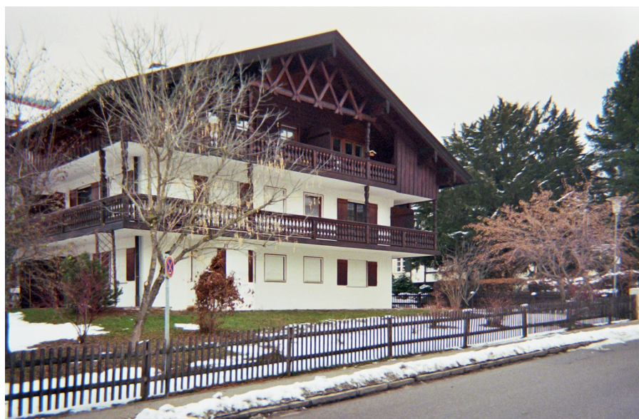
Foto 1 und 2: Eigentumswohnungen von multilokalen Akteuren in Tegernsee/Stadt

Die Häuser befinden sich im Ortskern von Tegernsee und sind nur zeitweilig bewohnt. Die dauerhaften Zeichen der Abwesenheit, wie z.B. geschlossene Rollläden, einfache Rasenflächen anstelle von gepflegten Vorgärten und fehlender Blumenschmuck, werden als ein Eingriff der multilokalen Akteure in das Ortsbild und damit letztlich in das symbolische Kapital des Ferien- und Erholungsortes Tegernsee gesehen. Die Wohnungen sind keine Ferienwohnungen, d.h. sie werden nicht an Touristen weitervermietet. Ferienwohnungen, Pensionen oder Appartements sind dagegen weit weniger konfliktträchtig, da diese meist vermietet sind und folglich die anwesenden Touristen im Ort flanieren, das Straßenbild allgemein beleben oder die Gaststätten und Straßencafés frequentieren. Die Ferienwohnungen bzw. Pensionen oder Appartementshäuser zeigen sich darüber hinaus in der Wahrnehmung der Tegernseer als gepflegter. Sie sind meist mit Blumenschmuck versehen und weisen zur Straßenfront ortstypisch angelegte Gärten auf. Ihre Rollläden sind meist oben. Der folgende Interviewauszug verdeutlicht dagegen die Problematik der nur selten frequentierten Zweitwohnsitze aus Sicht der Tegernseer Bürger.