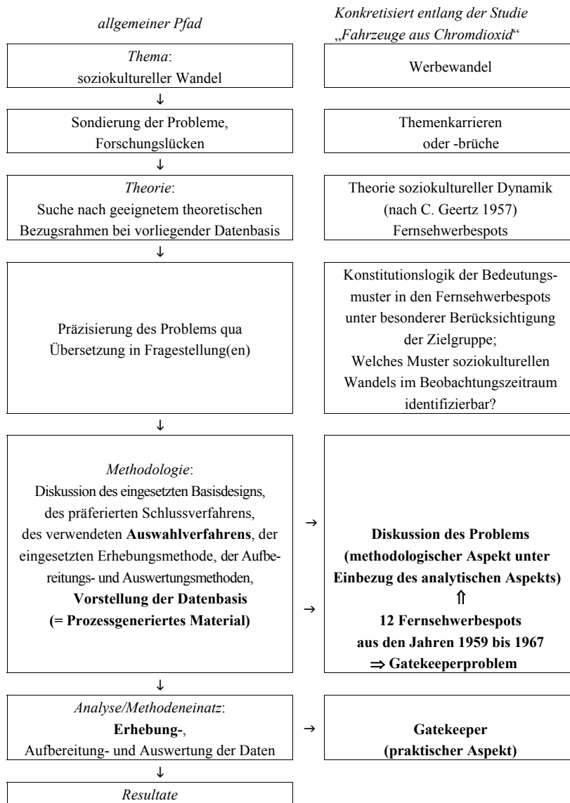
Grafik 1: Das Gatekeeperproblem im Forschungsprozess