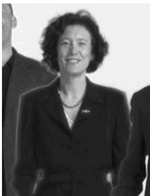
Abb. 4: Ausschnitt aus der Fotografie auf der Homepage der Beratergruppe Neuwaldegg

Der auffälligste Eingriff des fotografischen Autors ist vielleicht die teilweise Umräumung einiger Personen mit einer diffusen weißen Linie, die aus den Lichtverhältnissen (Lichtbrechung am Rand) so nicht erklärbar ist und die auch nicht als moderne Form des christlichen Nimbus angesehen werden kann. Auch fällt auf, dass die Personen, verlängert man ihren Körper, nicht auf demselben Boden stehen (besonders deutlich bei Person 3 und 4): Manche scheinen auf Fußbänken zu stehen. Offensichtlich wurden zu große Unterschiede der Körperlänge so ausgeglichen, dass eine dynamische ‚Gipfelinie‘ der Köpfe entstehen konnte. Auffällig an dieser Gipfelinie ist nicht nur das stetige Auf und Ab, sondern die Randpositionen (also Person 1 und 13): Sie bilden die äußeren hoch aufragenden Gipfel, die sich als einzige von der Gruppe weg, also nach außen neigen, was auf deren besondere Stellung hinweist. Drittens zeigen die abgebildeten Körper trotz ihrer Nähe zueinander keinerlei Koorientierung. Die Körper reagieren nicht aufeinander, sondern stehen wie Puppen nebeneinander. Man könnte das Abbild einer Person wegnehmen und ein anderes Abbild einfügen, ohne dass dies auffallen würde.