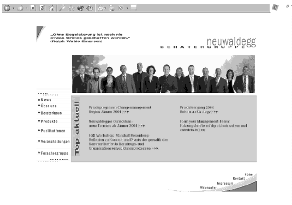
Abb. 1: Homepage der Beratergruppe Neuwaldegg

mester 2003 eine Gastprofessur an der Universität Wien wahr und eine Studentin schlug vor, die Methode der hermeneutischen Wissenssoziologie am Beispiel eben dieser Homepage zu erproben. Diese Interpretation wurde dann im Wintersemester 2003/04 im Rahmen eines Doktorandenkolloquiums an der Universität Duisburg-Essen, Campus Essen, weitergeführt, als die Verfasser dort die Möglichkeiten der Deutung von Homepages diskutierten. Dem Umstand, dass die Homepage an zwei, etwa acht Monate auseinander liegenden Zeitpunkten interpretiert wurde, ist es zu verdanken, dass auch vorgenommene Änderungen der Homepage in den Blick geraten konnten. Doch dazu später mehr. 7