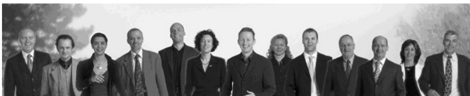
Abb. 3: Fotografie auf der Homepage der Beratergruppe Neuwaldegg

Alle Gesichter sind nach vorne gewandt. Mit hochgezogenen Augenbrauen schauen sie lächelnd und optimistisch nach vorne, ohne dass sich die Blicke aller auf ein einziges vor ihnen gemeinsam liegendes Ziel richten würde. Die ganze Gruppe scheint sich in einer Bewegung nach vorne zu befinden, die vor einiger Zeit inmitten des leuchtend hellen Hintergrunds begonnen hat, jedoch noch andauert und nur im Moment des Fotografierens und durch das Fotografieren kurz angehalten und eingefroren wurde. Insbesondere die bewegten Arme und die angedeutete Drehung aus der Körpermitte heraus unterstützen den Eindruck fortdauernder Dynamik. Durch diese Bewegung nach vorne erhält das eingefrorene Geschehen eine Zeitstruktur: es gab ein Vorher im Bildhintergrund (in der Helligkeit), es gibt eine Gegenwart (die Gruppe ist am vorderen Bildrand angekommen), und es wird eine Zukunft geben (dort, wo der Betrachter ist). 8