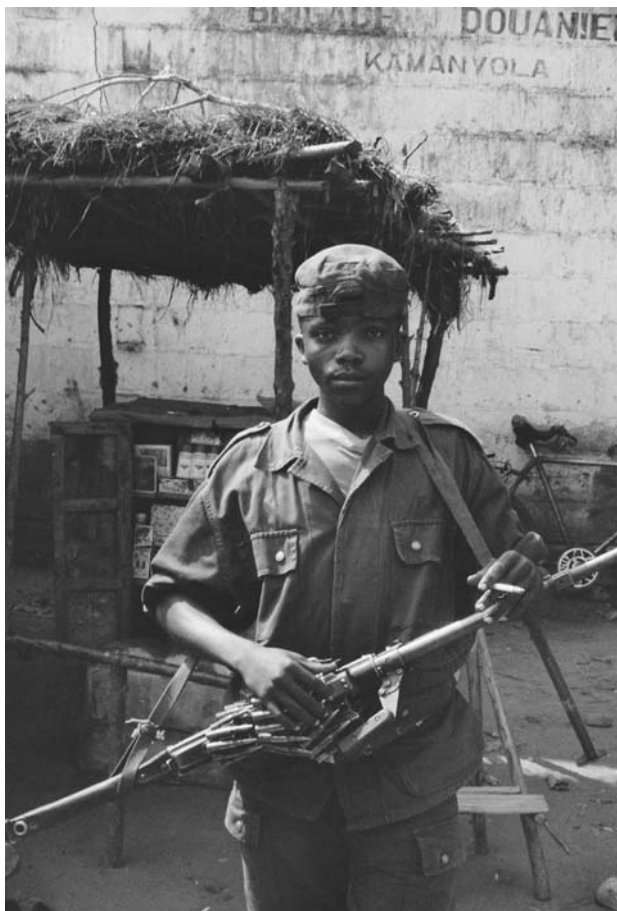
Abb. 3: Kindersoldat an einem Checkpoint in Kamanyola, DRK

Mit dem nach dem Genozid in Ruanda (und der damit verbundenen Flucht von mehr als einer Million Hutus nach Zaire) beginnenden Zerfall der Herrschaft Mobutus und der Spaltung des Landes in von verschiedenen Milizen kontrollierte Territorien ging die Vermarktung der Ressourcen auf Kriegsherren über. Dadurch veränderten sich zum Teil die Handelswege. Es kam zu unklaren Besitzverhältnissen und Auseinandersetzungen zwischen externen wirtschaftlichen Akteuren über ihre Rechte. Regionale Mächte haben sich immer wieder militärisch in die Konflikte im Kongo eingemischt. Die Kontrolle über Ressourcengewinnung und -vermarktung wurde zur Finanzierung dieser Aktivitäten genutzt; parallel kam es aber auch zur Bereicherung von Individuen in Streitkräften und Staatsapparaten. Regionale Mächte, mit rivalisierenden örtlichen bewaffneten Gruppen liiert, waren (und sind) die wichtigste Quelle für Waffen und Munition in der DRK.