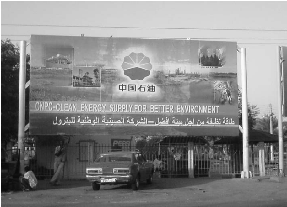
Abb. 5: Zunehmend investieren asiatische Unternehmen in die Rohstoff-Förderung in Afrika, hier die Werbetafel eines chinesischen Ölunternehmens in Khartoum, Sudan