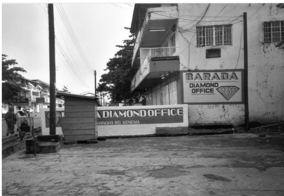
Abb. 6: Das Kimberley Process Certification Scheme ist ein völkerrechtlich verbindliches Zertifizierungssystem, um den illegalen Handel mit Diamanten einzudämmen. Hier ein Diamantenhändler in Kenema, Sierra Leone

fung von effektiven Kontrollmechanismen vor. In diesem Sinne ist etwa der belgische „Hohe Diamantenrat“ (als Vertretung der Industrie) seit Jahren in Sierra Leone tätig. Da sich das Kimberley Process Certification Scheme erst seit 2003 in Umsetzung befindet, ist es noch zu früh darüber zu spekulieren, wie erfolgreich das Regime langfristig sein wird. Trotz einiger Schwachpunkte (insbesondere im Bereich der nationalen Regulationsmechanismen) scheint das Kimberley Process Certification Scheme wesentlich dazu beigetragen zu haben, den Schmuggel mit Diamanten einzudämmen. So stiegen etwa die Einnahmen der Regierung von Sierra Leone von 10,1 Millionen US Dollar im Jahr 2000 auf 126 Millionen US Dollar im Jahr 2004. Bemerkenswert ist das hohe Engagement der Diamantenindustrie bei der Etablierung des „Kimberley Prozesses“, einerseits aus Angst vor Konsumentenboykotten, andererseits aber auch vor dem Hintergrund struktureller Veränderungen am Diamantenmarkt, die das etablierte Monopol der De Beers Gruppe bedrohten (Böge et al., 2006).