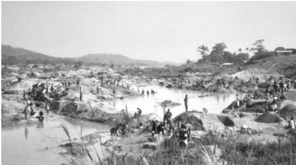
Abb. 4: Diamantenförderung in Flussbetten, hier im Kono Distrikt, Sierra Leone, ist personalintensiv, erfordert jedoch geringere technische Kenntnisse und weit weniger Kapitaleaufwand als der Abbau in Minen

Erdöl als „Staatsrohstoff“ und alluviale Diamanten als „Rebellenrohstoff“ stellen Extremfälle in einem weiten Spektrum von natürlichen Ressourcen dar, die zum Konfliktgegenstand werden können und den Konfliktaustrag finanzieren. Andere Rohstoffe, die diese Funktion erfüllt haben, sind in Tabelle 1 beschrieben. Gemeinsam ist diesen Rohstoffen, dass externe wirtschaftliche Akteure an ihrer Vermarktung beteiligt sind und somit Einfluss auf die Entstehung und Dynamik von Konflikten haben, allerdings in unterschiedlicher Form.