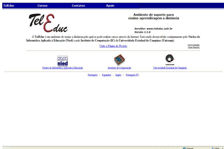
FIGURA 2 – Interface da página inicial do Teleduc UNIR (2008) 4

A seguir, passamos a relatar as vivências com esse ambiente de aprendizagem durante os anos de seu funcionamento regular nesta IFES.