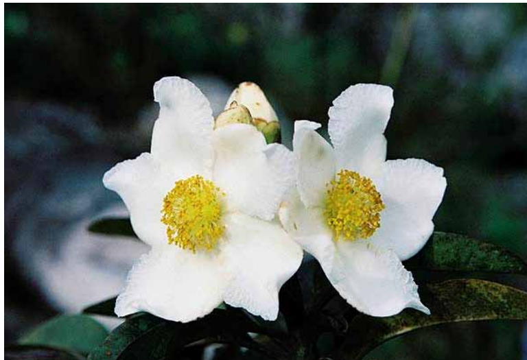
FIGURA 5 – Flora da Chapada Diamantina 5

Diamantina . Movimento imprescindível de ser realizado, para que se tornasse possível a produção de uma outra versão daquele lugar, uma outra Chapada Diamantina que não fosse resumida a “belezas grandiosas”, a uma “paisagem deslumbrante”, ou que os closes não se fizessem apenas nos animais e na vegetação, como se essas fossem a verdade dita, via imagens, sobre aquele lugar, como podemos observar em algumas fotografias retiradas de uma página da internet: