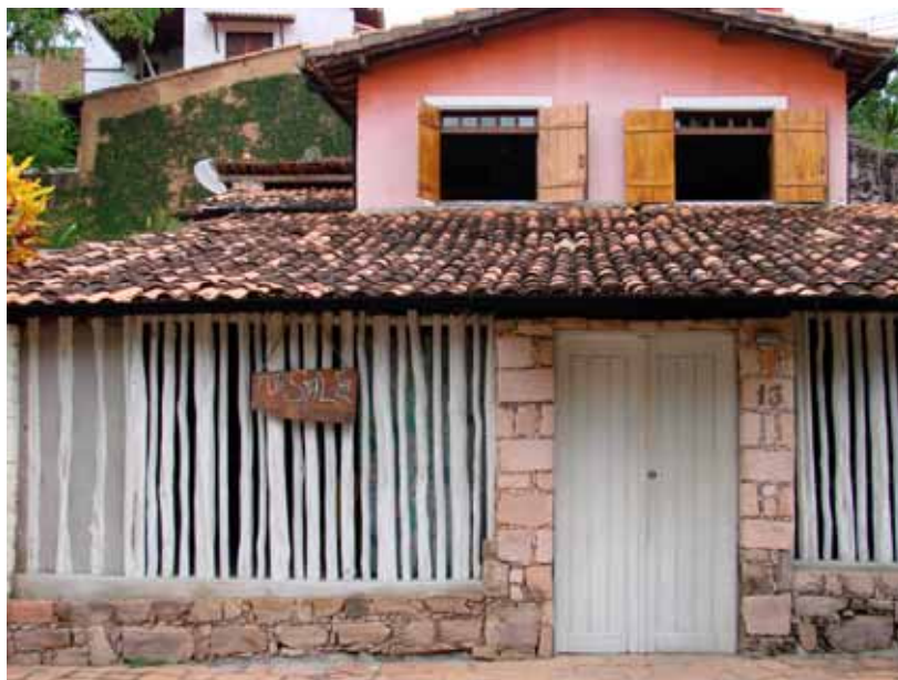
FIGURA 8 – Casa à venda em Lençóis-BA 8

No percurso da gruta, realizamos a trajetória que foi pensada para ser “vista de frente”, a atração principal, o letreiro que brilha, pisca e nos encanta. As imagens editadas pela mídia, ao mostrarem apenas o interior das grutas, nos ensinaram que o caminho realizado fora dela, deveria passar despercebido por nós, configurando-se como algo circunstancial, uma eventualidade e para Doreen Massey, essas características também participam da definição de um lugar. Por isso, a fotografia da casa (Fig. 07), passou a compor para nós uma das marcas daquele lugar, principalmente porque ela iria conversar com a fotografia de outra casa: