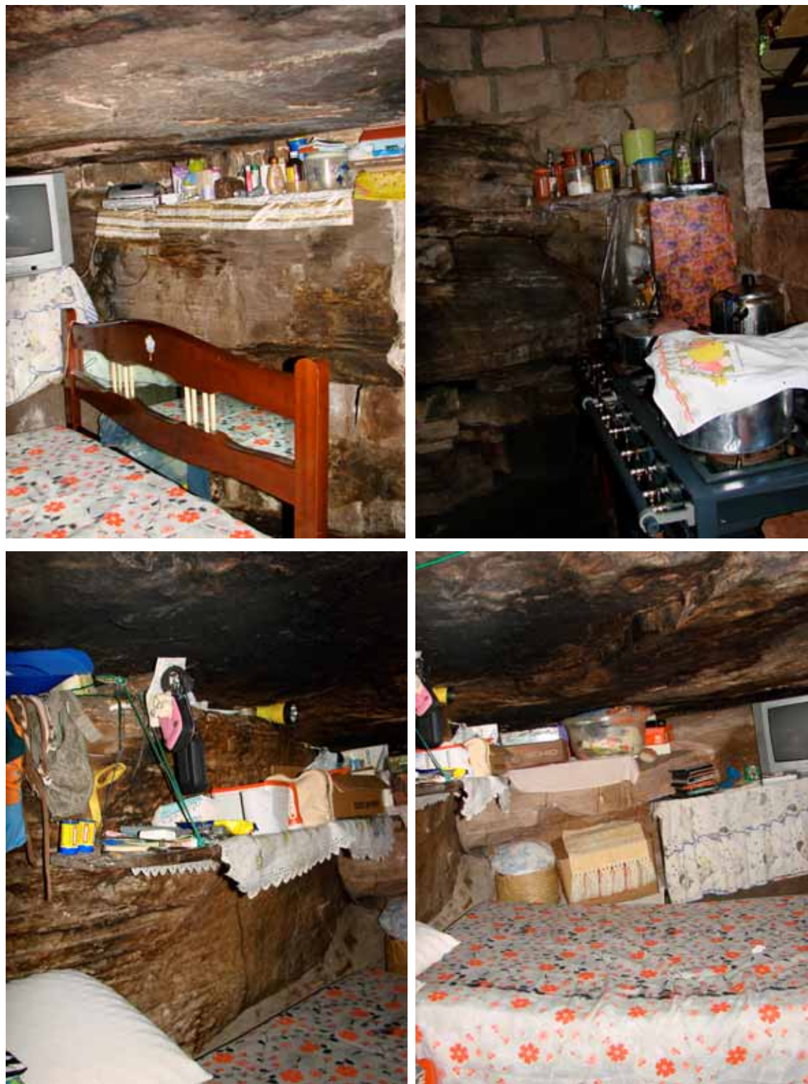
FIGURA 11 – Casa de Pedra 11