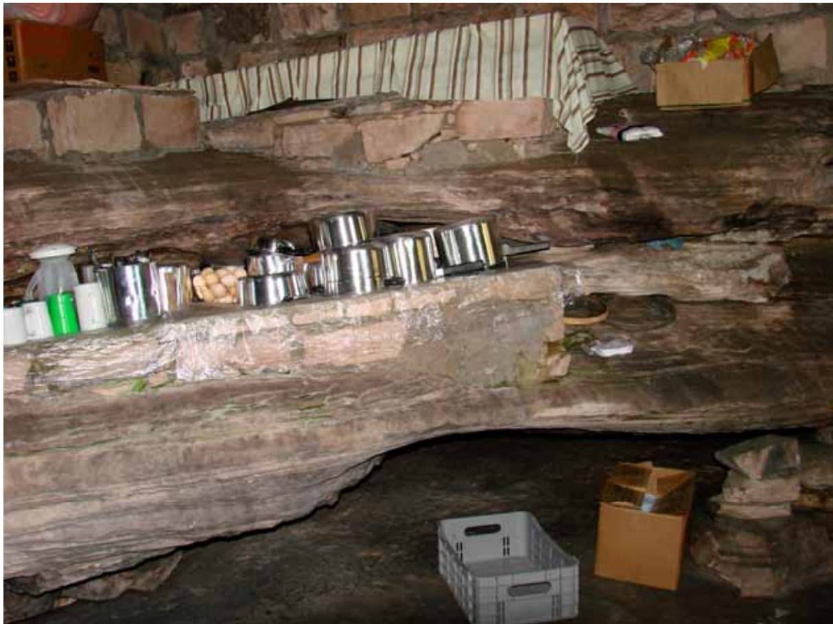
FIGURA 10 – Casa de Pedra 10

Queríamos a beleza presente naquilo que é – em face desse grande teatro, com seus movimentos programados e com suas marcações definidas – “desarticulado” (MASSEY, 2008). Queríamos o ator que pisa fora da sua marca feita no chão, aquela que define seus movimentos em cena, e que sai do enquadramento da câmera, fazendo com que o diretor grite furiosamente: corta. Queríamos as imagens da negociação que, para muitos, não existe. Algumas dessas imagens participam dessa versão de forma que considero a mais intensa: