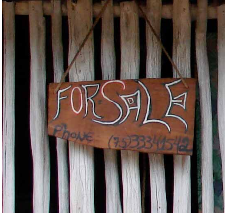
FIGURA 9 – Placa anunciando casa à venda em Lençóis-BA 9

Talvez essa seja a maior marca da constante negociação que acontece naquele lugar. Ela é constante, mas é também silenciosa e se espalha por toda a cidade. Ao sairmos da gruta nos deparamos com uma barraquinha onde estava sendo vendido: água, refrigerante, água de coco e até cerveja. A forma orquestrada e sincrônica como as pessoas que vendiam começaram a dizer repetidamente o que estavam vendendo, me chamou bastante atenção. A Chapada Diamantina começou ali e me parecer uma grande maquete, daquelas que se apertam um ou dois botões e tudo começa a funcionar, num automatismo pensado para encantar a quem olha. Porém, não estávamos ali para consumir esse tipo de encanto, pois, nas palavras de Oliveira Jr,