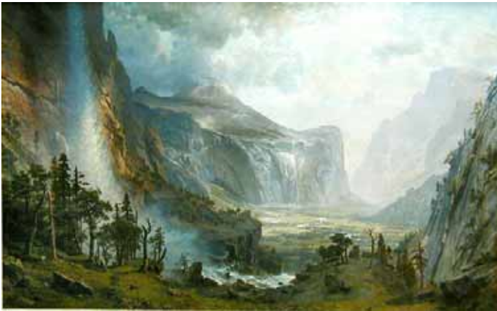
FIGURA 1 – “Domes of Yosemite”, por Albert Bierstadt. 1

“Embora o estacionamento seja tão grande quanto o parque e os ursos estejam fuçando entre embalagens do Mc Donald’s, ainda imaginamos Yosemite como Albert Bierstadt o pintou ou Carleton Watkins e Ansel Adams o fotografaram: sem nenhum vestígio humano.” (SIMON SCHAMA – Paisagem e Memória)