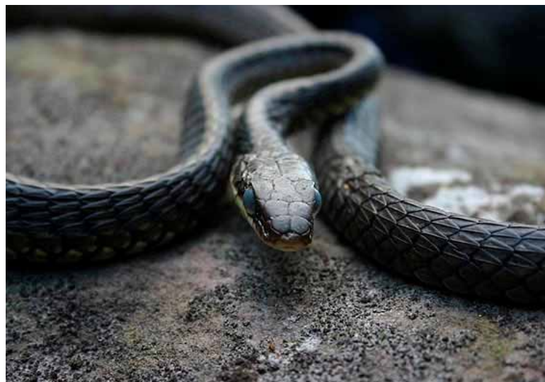
FIGURA 6 – Fauna da Chapada Diamantina 6