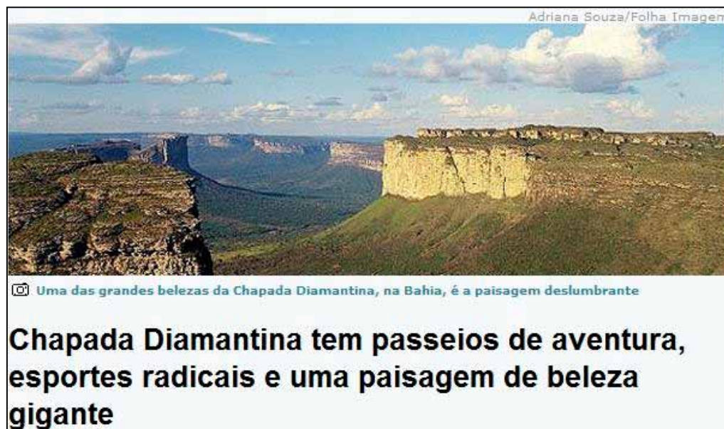
FIGURA 4 – Reportagem sobre a Chapada Diamantina 4

Mobilizados por essas belas palavras de Susan Sontag, nos perguntamos: que tipo de imagens, de sensibilidade corpórea, de cartilha visual, de compreensão do lugar-Chapada Diamantina, nos propusemos a dizer não? Que outros enquadramentos, que outros significados poderíamos produzir/comunicar, que não o da mais recorrente das imagens da Chapada Diamantina: