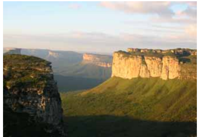
FIGURA 2 – “Morro do Pai Inácio”, na Chapada Diamantina 2

Há um aspecto contido nessas palavras de Simon Schama, que me chama bastante atenção. Quando lemos a expressão “ainda imaginamos”, o historiador britânico está a nos dizer como o modo que concebemos um determinado lugar ou coisa, está fortemente ligado a maneira a qual esse mesmo lugar ou coisa tomou existência a partir de um conjunto de fotografias e pinturas.