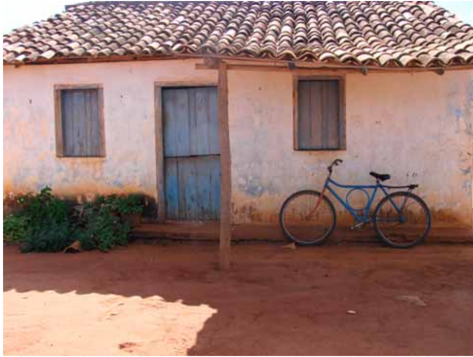
FIGURA 7 – Casa na saída da gruta 7

Fizemos um percurso por dentro de uma gruta. Na saída dela, caminhamos por uma pequena estrada de terra que nos levaria novamente até a entrada da gruta, onde os ônibus estavam estacionados. Ao realizarmos esse caminho de volta, a sensação era a de que estávamos passando por trás daqueles letreiros que foram feitos para serem vistos de longe e só quando chegamos perto, notamos os detalhes da sujeira, das pichações, ou seja, marcas de um uso que só aparece quando tomamos outra posição, diferente daquela que nos foi indicada para realizamos.