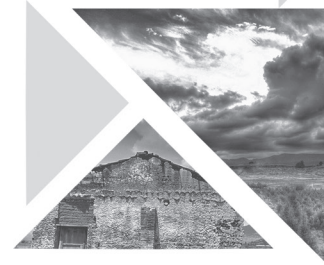
Detalles. Fotografía digital D./N. Arturo de Jesús Martínez Domínguez.

Publicación del Centro de Investigación y Estudios Avanzados en Ciencias Políticas y Administración Pública, de la Universidad Autónoma del Estado de México.