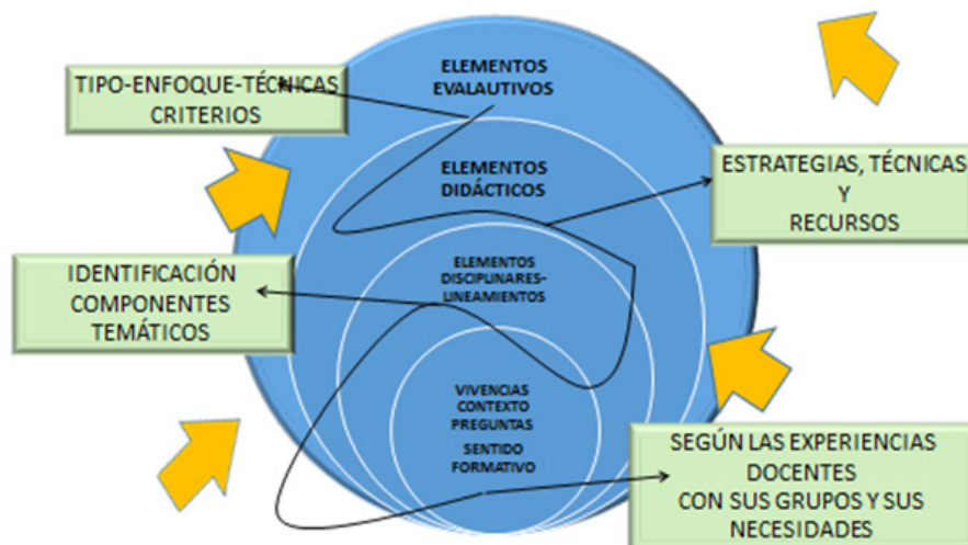
Figura 3. Que relaciona los campos contextuales, disciplinares, didácticos y evaluativos