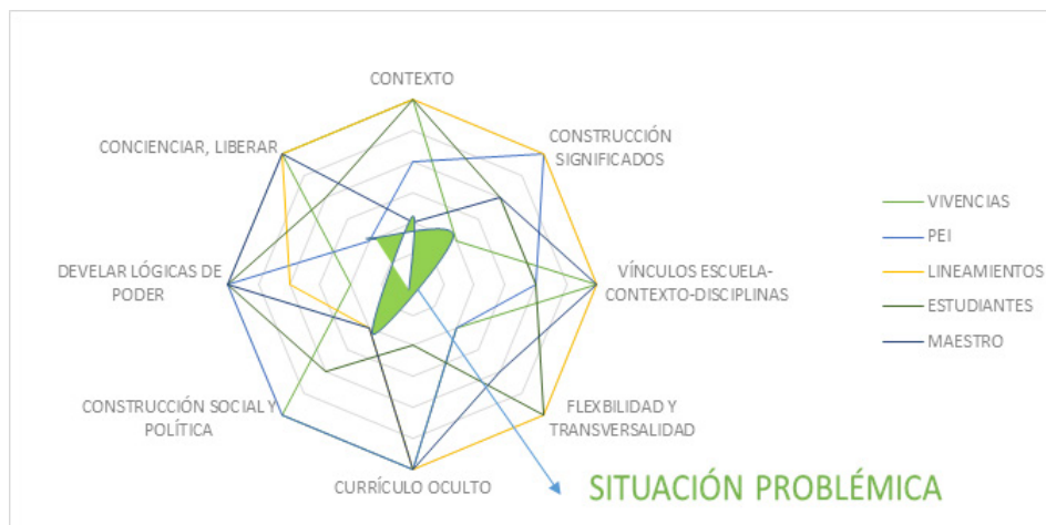
Figura 2. Currículo octagonal, que relaciona los campos problematizadores de un currículum crítico.