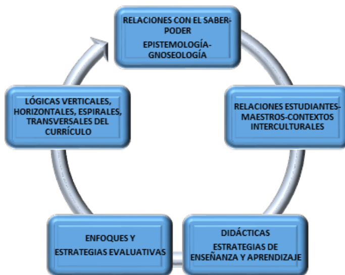
Figura 1. Que relaciona 5 componentes de reflexión crítica en el campo pedagógico