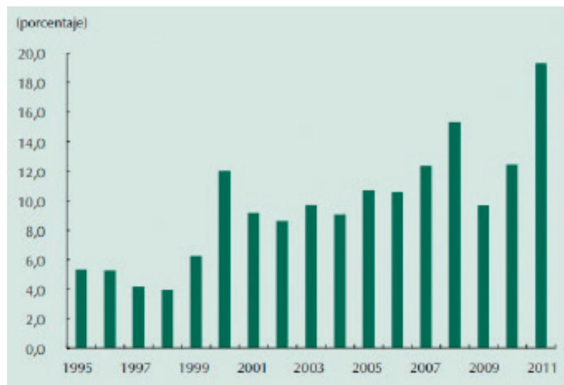
Gráfica No. 4 Ingresos por la actividad petrolera como porcentaje de los ingresos corrientes del GNC9 Tomado de: Banco de la República (2013)

El Marco Fiscal de Mediano Plazo diseñado por el Ministerio