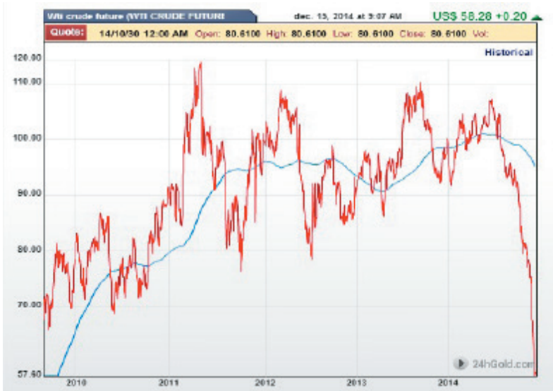
Gráfica No. 3 Evolución del Precio del Petróleo 2010-2014