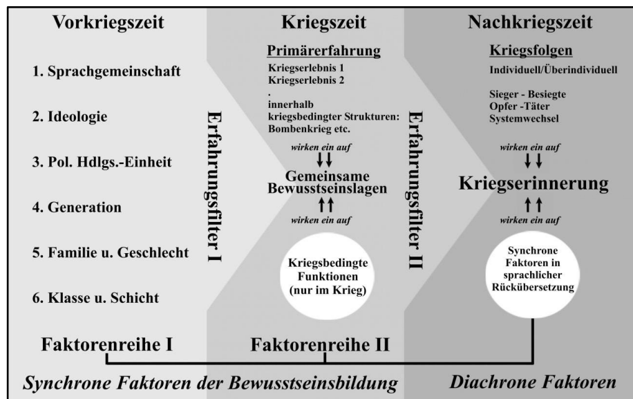
Abb. 2: Synchroner und diachroner Faktoren am Beispiel der Kriegserinnerungen

Die nachfolgende Graphik ist nun der Versuch, diese Faktoren in ihrer Wirkung auf das Bewusstsein vereinfacht abzubilden und damit Kategorien für die weitere Arbeit mit autobiographischen Quellen zu beschreiben.