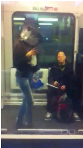
Abb. 6: Filmstill 4