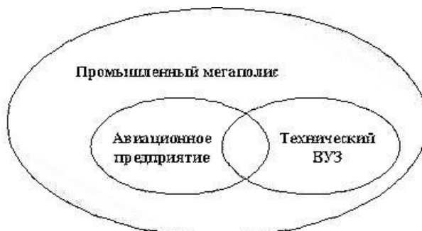
Рис. 3. Корпоративная образовательная площадка ОАО «ОАК»

Решение названной проблемы было найдено в создании корпоративной образовательной площадки, состоящей из базового авиационного вуза и базового авиационного предприятия, расположенного в одном городе (рис. 3).