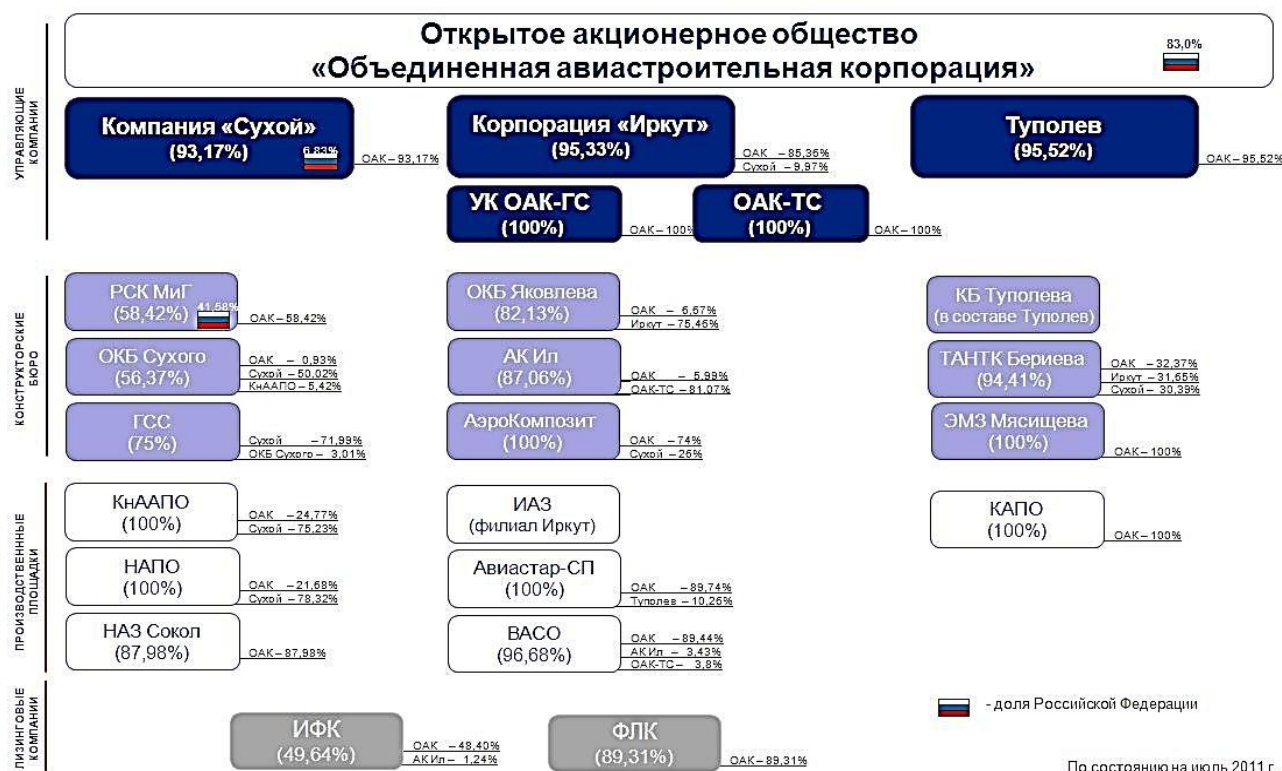
Рис. 1. Структура ОАО «ОАК»

Развитие бизнеса ОАО «ОАК» происходит в трех основных сегментах – гражданской, военной и военно-транспортной авиации. Для каждого из сегментов определены стратегические ориентиры, достижение которых обеспечивает реализацию глобальной цели ОАО «ОАК» – выхода на лидирующие позиции в мировом авиастроении. ОАО «ОАК» обеспечивает концентрацию имеющихся материально-технических, финансовых и интеллектуальных ресурсов на нишах с ограниченной конкурентной напряженностью с постепенным переходом к конкуренции на сегментах массового спроса. Комплекс предусмотренных мер обеспечивает динамичное развитие ОАО «ОАК» и связанных с Корпорацией предприятий российской промышленности на основе современных рыночных принципов и механизмов корпоративного управления.