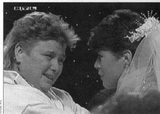
Traumhochzeit . Symbolische Trauung von zwei lesbischen Frauen

stimmter Personen berichtet. Spenden aller Art (Geld, Blut, Wohnungs- und Arbeitsangebote etc.) werden eingeworben und natürlich auch gerne genommen. Und natürlich können auch die vom Leid Betroffenen im Fernsehstudio Trost, Hoffnung und Unterstützung erlangen ( Schreinemakers live ). Diese Sendung der ehemaligen Schwesternschülerin ist im übrigen ein schönes Beispiel christlicher Gemeindegemeinschaft zu Zeiten allgegenwärtiger Fernsehpräsenz.