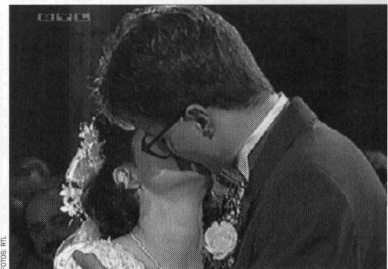
Traumhochzeit. Das Paar fühlt sich nach der Fernsehhochzeit real verheiratet

wo bislang vor allem die Kirche geholfen hat. Verheißung, Vergebung, Verkündigung, Trost, Caritas und Magie haben (wenn auch in neuen Kleidern) ein neues Heim gefunden: Nicht mehr (allein) in der Kirche sind sie ansässig, sondern (auch) im Fernsehstudio.